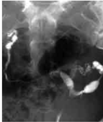
Photo n°3 : Malformation de la cavité utérine (utérus cloisonné)